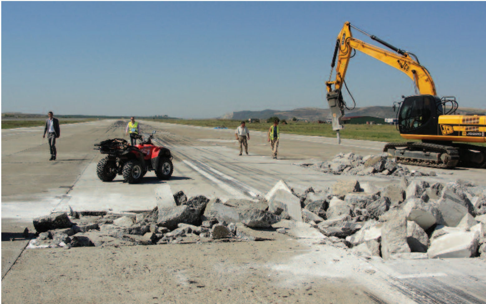
A kifutópálya 2012-es, jelentősebb javítása