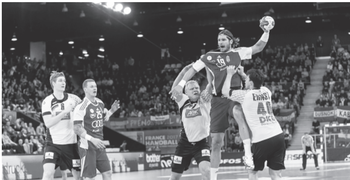
A magyar csapat vezéregyénisége lesérült a németek elleni mérkőzésen

Hosszú interjút közölt a férfikézilabda-világbajnokság honlapja a magyar válogatott 35 éves jobbátlövőjével szombaton, miután lesérült a németek elleni mérkőzésen, illetve ennek következtében ki is került a magyar válogatott keretéből (egészségi állapota javulása függvényében azonban még előfordulhat, hogy a következő mérkőzéseken visszatér – a szerk.).